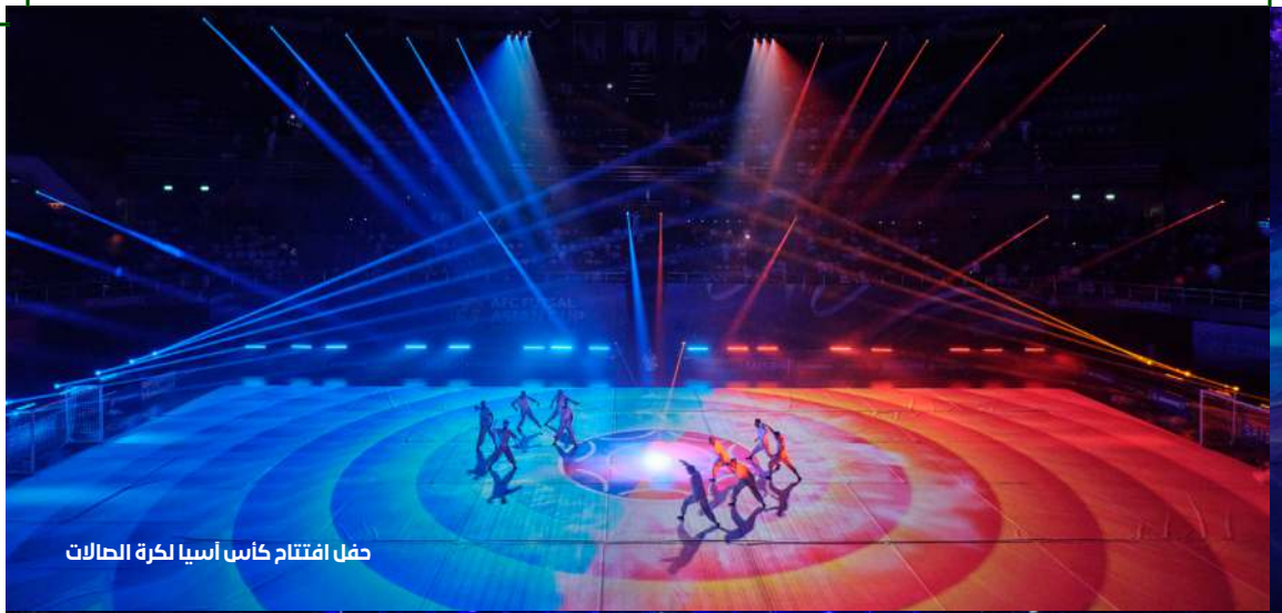
حفل افتتاح كأسى آسيا لكرة السلات