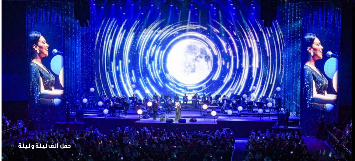
حفل ألف ليلة و ليلة