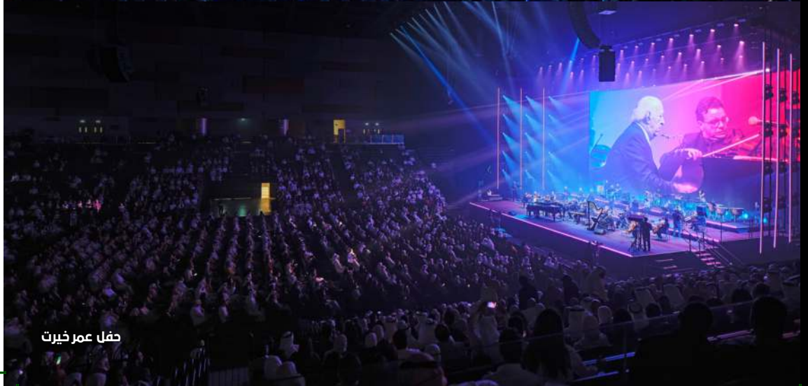
حفل عمر خيرت